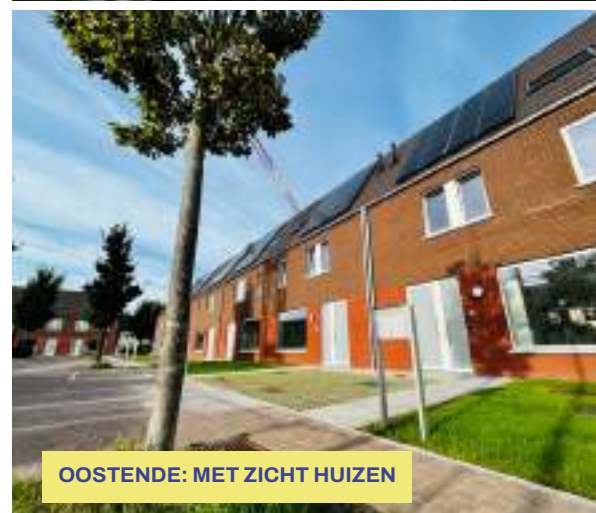
OOSTENDE: MET ZICHT HUIZEN