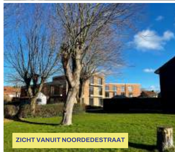
ZICHT VANUIT NOORDEDESTRAAT